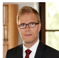
** Rechtsanwalt, Fachanwalt für gewerblichen Rechtsschutz, Kanzlei Büsing, Müffelmann & Theye (BMT), München brau@bmt.eu